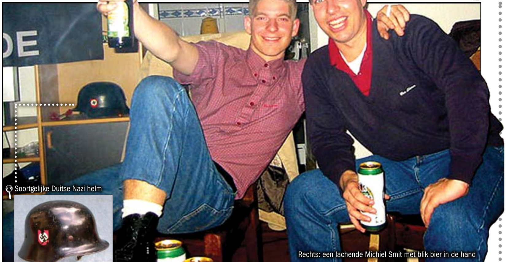
Soortgelijke Duitse Nazi helm